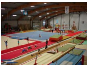
Photo: salle d'entraînement de gymnastique artistique du Bois-des-Frères